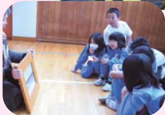
▲視覚障害者疑似体験 (和小学校)