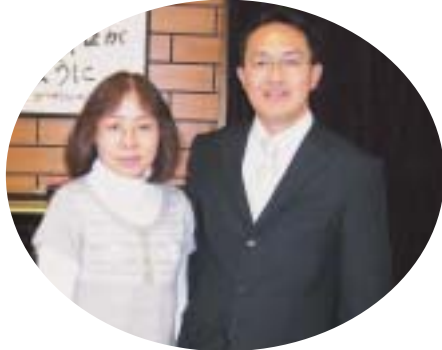
▲東御キリスト教会様