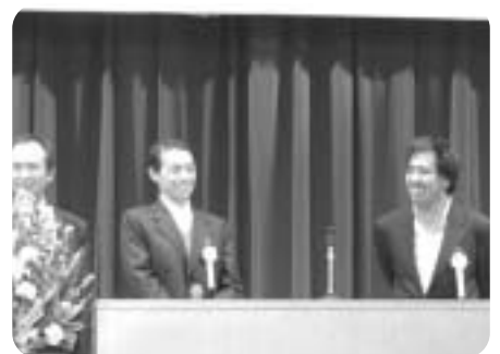
体験発表も行いました