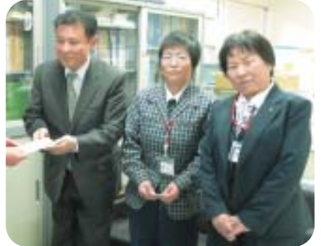
▲北信ヤクルト販売㈱様