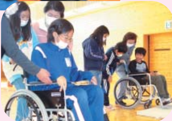
▲車いす体験 (田中小学校)