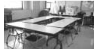
▲ボランティアルーム