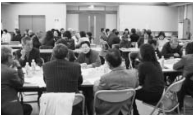
▲昨年の和地区地域福祉懇談会より