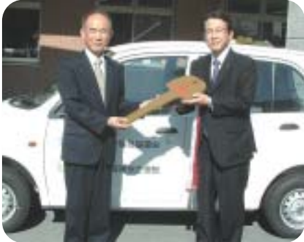
▲長野県生命保険協会様