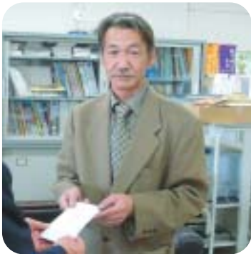
▲上小理容組合上小支部様