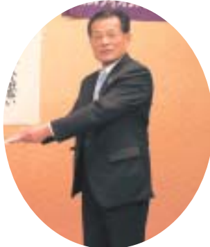
▲東御ライオンズクラブ様