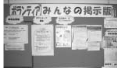
▲掲示板 ボランティアルームの前に設置

東御市ボランティアセンターでは、ボランティア活動の相談や、ボランティアの派遣・調整を行い、ボランティア活動の輪を広げています。ボランティアの方が、自由に使用できるボランティアルームも2部屋設置し、市民のみなさんが気軽に利用できる拠点です。また、ボランティア養成講座の開催や、ボランティア情報の提供、活動用機材の貸し出し等も行っています。場所は東御市総合福祉センターの1階にあります。