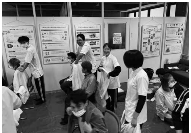
▲長野救命医療専門学校コーナー