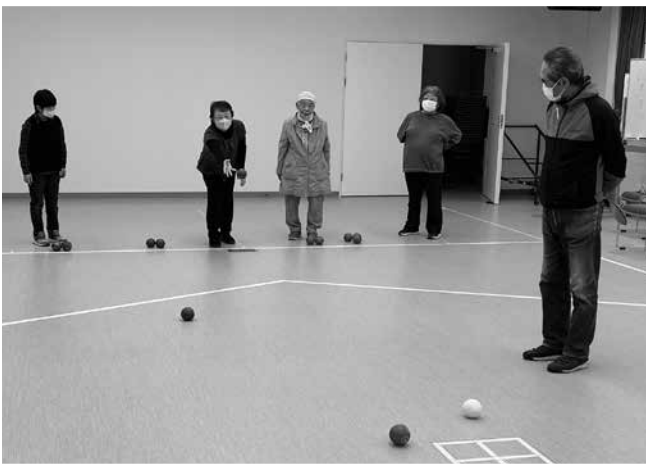
▲ボッチャ体験コーナー