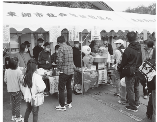
▲にぎわう「おらほ横丁」