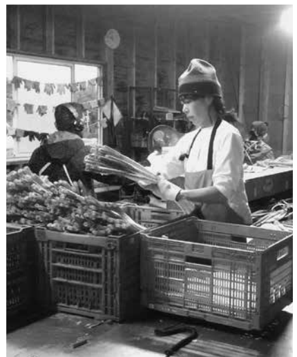
▲「アマリファーム」さんから被災地支援バザー用の野菜が寄付されました