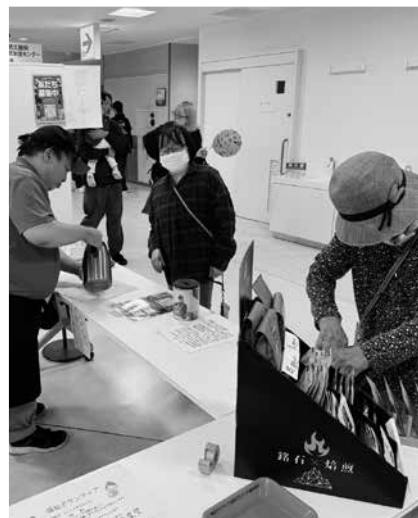
▲「コーヒー」はいかが…