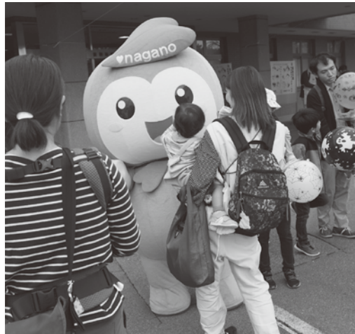
▲子どもたちとふれあう「ふっころ」