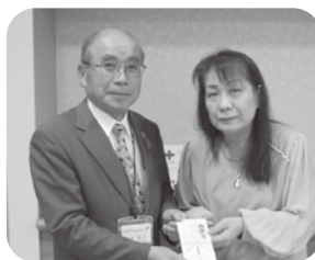
▲美容室フォルテ様