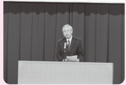
▲ご来賓の皆様のご挨拶 (写真は田丸副市長)