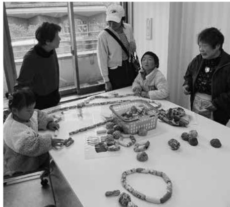
▲むかしあそびの会