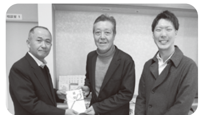
▲東御キリスト教会様