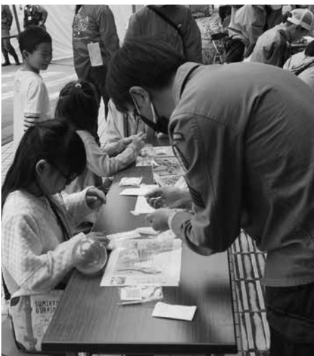
▲プラ板工作コーナー