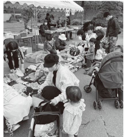
▲にぎわう「被災地支援バザー」