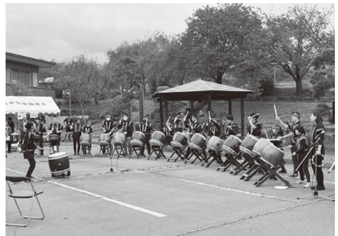
▲オープニングセレモニー「音楽を楽しむ会スキップ」