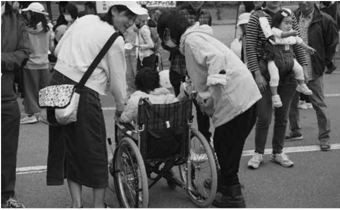
▲車いす体験コーナー