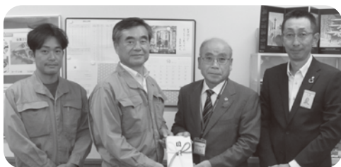
▲ヒカリ素材工業(株)様