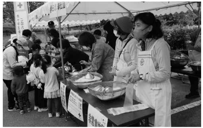
▲赤十字奉仕団コーナー