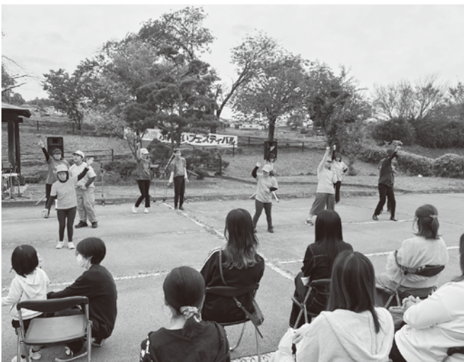
▲ステージ発表する「ダンスグループ・カラフル」