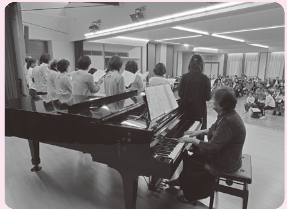
▲障がいがあってもなくても、誰でも参加できる合唱団。ピアノの演奏にのせて…♪