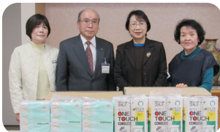
▲東御市くらしの会 様