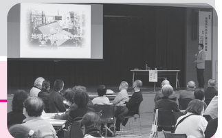
▲ 災害ボランティア養成講座