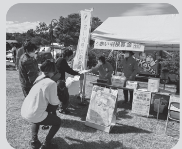
▲ 赤い羽根共同募金