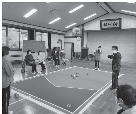
▲ 社協の出前講座（ボッチャ）

… 色んな楽しみ・効果が期待できます♪ サロンの開催時期や参加の対象になるかは、地域の役員さんに尋ねてみましょう。