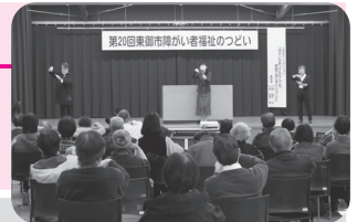
▲ 障がい者福祉のつどい