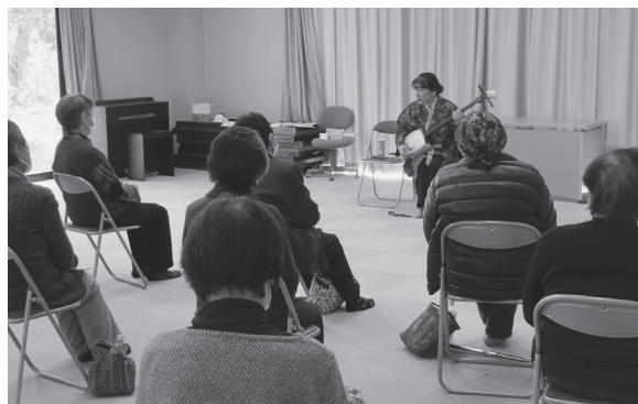
▲ 芸能人材グループ～和笑～（越後替女唄）