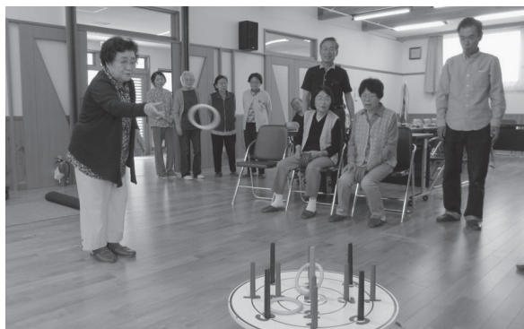
▲ レクリエーション貸出（ちゃぶ台輪投げ）