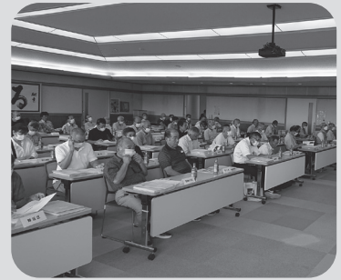
▲ 支部長会議（会費収納会議）