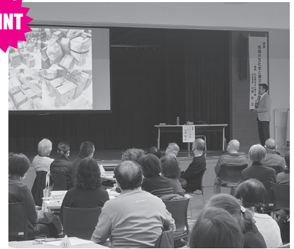
▲ 現地の写真を交えながらの講演