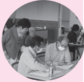
▲ 福祉運営委員長研修会