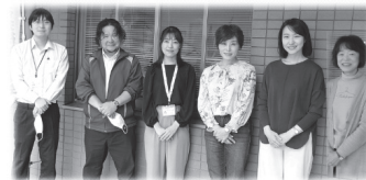
▲令和5年度のまいさぽ職員