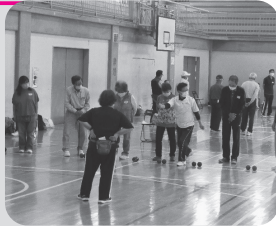
▲ 福祉団体交流会 (ポッチャ)