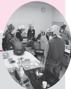
▲ 男性の料理サロン