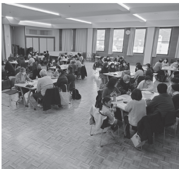
▲ 災害をテーマに話し合う