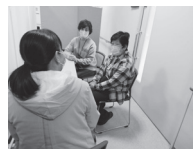
▲年末の相談会の様子