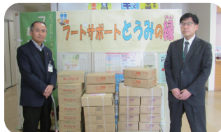
▲信州うえだ農協東御支所 様