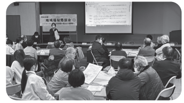
▲ 地区別地域福祉懇談会

社協は、地域住民の皆さんに会員としてご参加いただき、地域福祉活動を推進していく組織です。様々な事情により、自ら福祉活動に参加できない皆さんの善意の気持ちも、社協が形に変えて地域へお届けします。社協の4つの係がそれぞれ、地域の皆さんと共に活動しています。