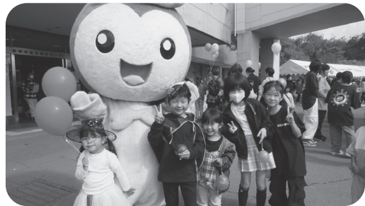
▲ 福祉の森ふれあいフェスティバル