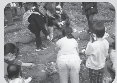
▲ 子どもだれでも居場所「くる me」